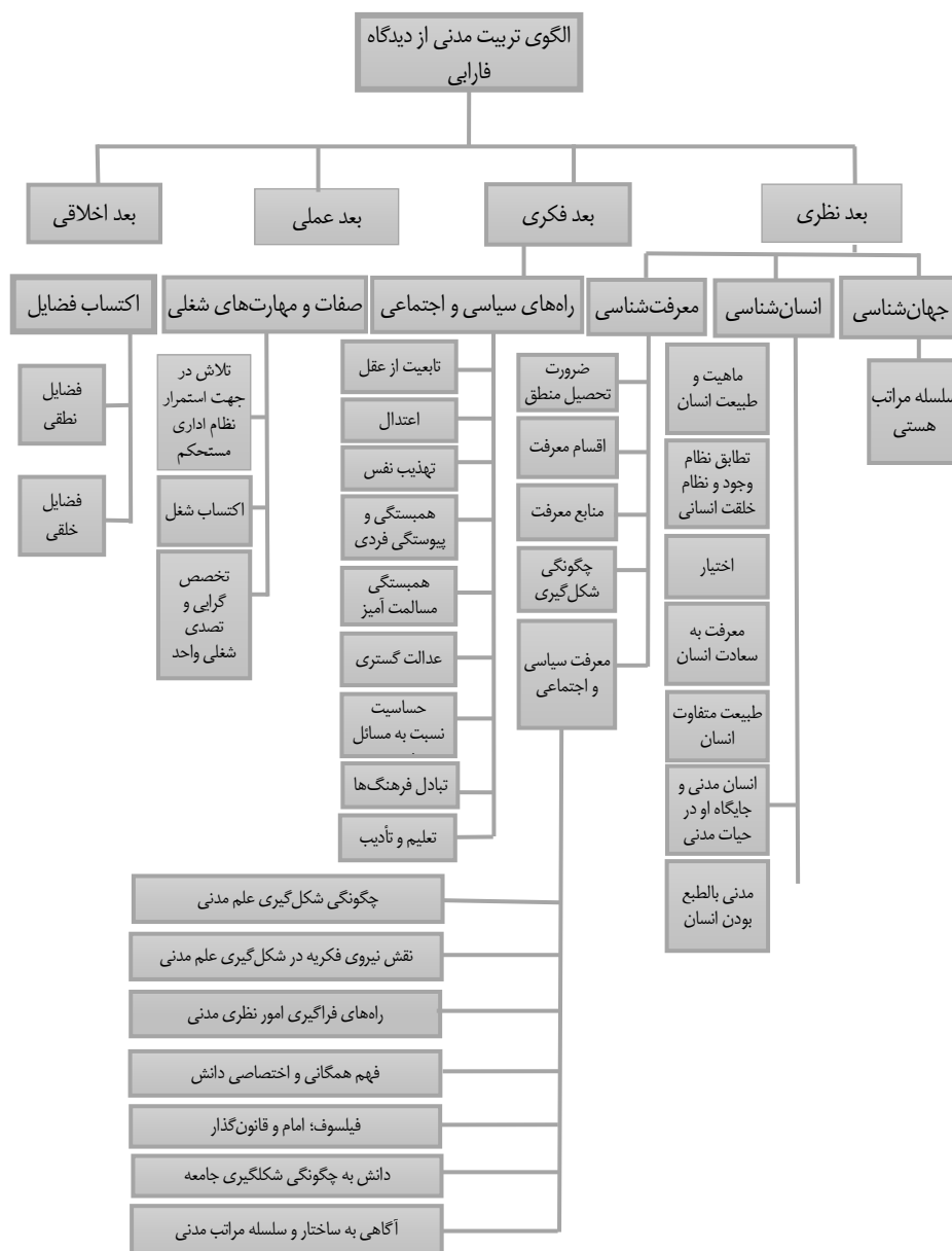
شکل شماره ۲: الگوی تربیت مدنی از دیدگاه فارابی

در این مرحله و برای پاسخ گویی به سؤال سوم پژوهش، مضامین، به صورت نقشه‌های شبکه تارنما رسم شده است و هریک از مضامین و روابط بین آنها در قالب الگو نمایش داده شده است (شکل شماره ۲).